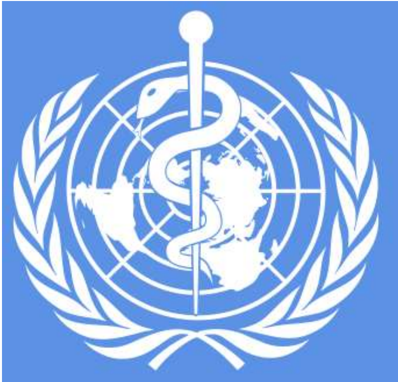
Símbolo de la OMS