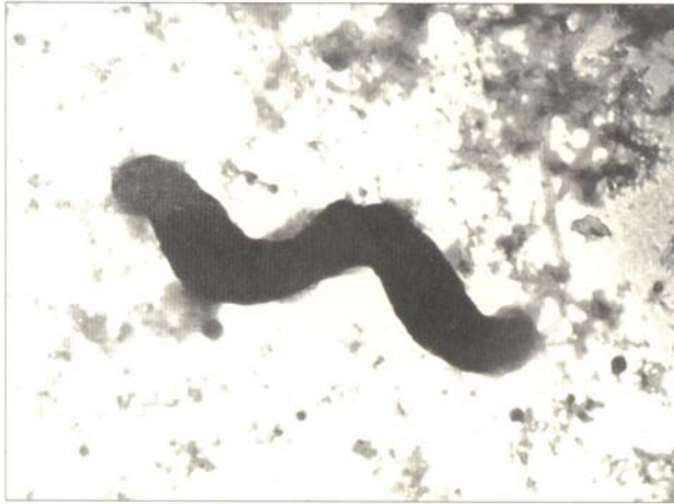
Figura 3. Célula de Campylobacter . Microscopía electrónica 15.000X.

Tienen un metabolismo típicamente respiratorio. Utilizan como fuente de carbono algunos aminoácidos y compuestos intermedios del ciclo del ácido tricarboxílico. Reducen el nitrato (a excepción de C. jejuni subsp. doylei ) pero no el hipurato (exceptuando C. jejuni ), y son incapaces de fermentar u oxidar carbohidratos. Reducen el fumarato a succinato, son rojo de metilo y Voges-Proskauer negativas, no producen indol (a excepción de C. gracilis ). La gran mayoría de las especies son catalasa y oxidasa (exceptuando C. gracilis ) positivas, y ureasa negativas. Generalmente no son hemolíticos, aunque C. jejuni y C. coli pueden serlo cuando son incubados a 42°C. Tienen un bajo contenido en bases G+C de 28-46 mol%. En la tabla 3 se recogen algunas de las propiedades bioquímicas más importantes de las especies de este género.