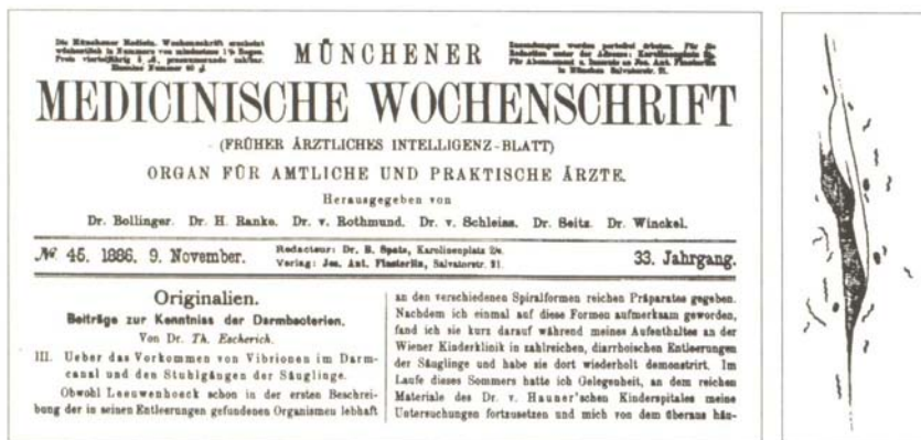
Figura 1. Publicación y dibujo original de Escherich en 1886 de la bacteria espiral encontrada en el colon de un niño fallecido por ‘cólera infantum’.

Los microorganismos hoy considerados como Campylobacter , fueron probablemente observados por primera vez en 1886 por Theodor Escherich en Alemania quien publicó una serie de artículos sobre bacterias intestinales en la revista Münchener Medizinische Wochenschrift . Escherich observó al microscopio unas bacterias con morfología espiral a partir del mucus intestinal de niños recién nacidos que habían muerto de una enfermedad diarreaica que él denominó ‘cólera infantum’. Posteriormente, también observó microscópicamente esas formas espirales en las heces de otros niños que sufrían de enfermedad entérica. Todos sus intentos por cultivar en medios sólidos esos ‘vibrios’ fueron, sin embargo, infructuosos, concluyendo que su presencia constituía un valor de pronóstico más bien que un significado causal, es decir, pensó que no jugaban ningún papel etiológico. Desafortunadamente, sus trabajos fueron publicados en alemán, y no tuvieron repercusión durante décadas hasta que fueron resaltados por Manfred Kist en el transcurso del Tercer Congreso Internacional de Campylobacter celebrado en Ottawa en 1985.